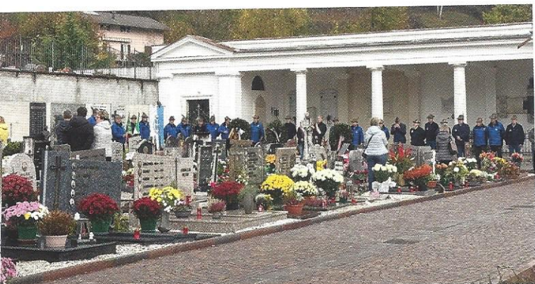
Gli Alpini con le autorità al cimitero di Roncegno.

della vita quotidiana. Beatitudini che sono infatti il tratto evangelico proclamato nella festività. Beati è una felicità grande, al tempo si pensava addirittura irraggiungibile su questa terra; una condizione che raggiungeremo già su questa terra, una possibilità immediata che ci è data. Con questa speranza quindi anche quest'anno la comunità di Roncegno si è riunita in preghiera; una preghiera replicata anche domenica 2 novembre, giornata dei morti, con la messa nel solito orario prefestivo seguita anche in questo caso dalla visita sul cimitero. In quest'occasione, si è anche celebrato il ricordo di tutti i caduti nelle guerre, in occasione della giornata dell'Unità nazionale che tradizionalmente cade il 4 novembre. Il gruppo Alpini di Roncegno ha organizzato la benedizione della corona d'alloro che, accompagnata dalle autorità civili di Roncegno e di Novaledo, è stata deposta dopo una breve processione al monumento ai caduti posto in Piazza Montebello. Un grazie anche da queste righe al Gruppo Alpini che con dedizione e passione fa partecipare tutta la comunità di questi momenti importanti, per ricordare quanto la guerra, ogni guerra, sia foriera di morte e di distruzione.