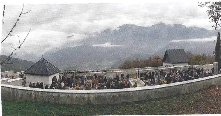
Un momento della festività di Ognissanti

Quest'anno, nonostante un fortissimo acquazzone serale, don Paolo e i fedeli presenti non si sono scoraggiati e sono andati in processione al cimitero per la benedizione delle tombe dopo la messa celebrata in chiesa.