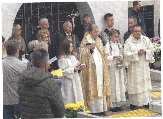
Messa di Ognissanti

La solennità di Ognissanti ci ricorda che, chiamati alla santità, siamo invitati alla gioia delle beatitudini. Ed ecco che nei giorni dell'1 e del 2 novembre tutti noi partecipiamo alle celebrazioni nei vari cimiteri con una visita sulle tombe dei nostri cari. La vita cristiana è un pellegrinaggio gioioso di santità, perché la meta è la casa dove il Signore attende i propri figli a braccia aperte. Con questa festivi-