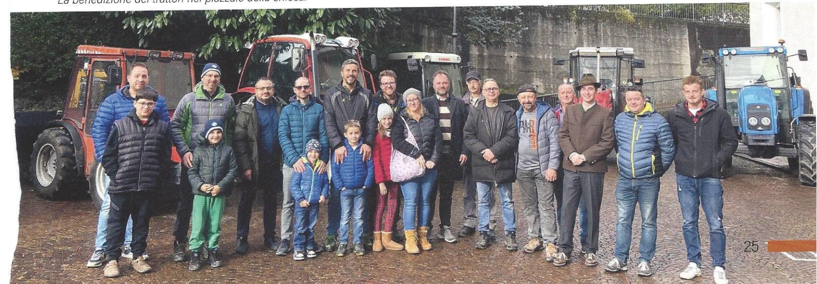
La benedizione dei trattori nel piazzale della chiesa.

servizio, per i beni e i frutti di questo lavoro messi a disposizione per i fratelli più bisognosi. Attraverso la benedizione dei beni e dei mezzi agricoli, si vuole infatti ringraziare il Signore per ogni lavoro che viene messo a frutto per il bene collettivo, in un rapporto di fraternità con le altre persone. Dopo la messa, c'è stata infatti la consueta benedizione dei mezzi. Un grazie a chi si prodiga per tenere vivo questo momento che è di ringraziamento, ma al contempo anche di accoglimento dei doni che la terra e il creato ci offrono tutti i giorni.